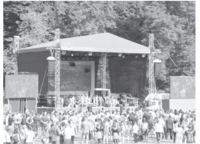
A hét végén is sokakat várnak a színpadok elé szórakozni, kikapcsolódni, koncertezni

gyergyószentmiklósi 4S Street, a Lady&The Tramp után a román popzenét egyik meghatározó tehetsége, Alex Velea lépjen közönség elé, a napot pedig a másik sztárfellépő, az aranylemezes Honeybeast magyarországi együttes és tűzijáték zárja. Nem sok idő marad a pihenésre, hiszen vasárnap reggel folytatódnak a sportrendezvények, délután pedig a Szováta Népi Játsszóház helyi iskolások, fiatalok fellépésével szervez néptáncbemutatót a nagyszínpadon, ahol a Sóvirág, a Sirülők és a Bokréta néptáncsoport mellett Katona Sarolt is fellép. A népi hangvétel az estébe is átnyúlik, hiszen a délután sem tétlenkedő Kedves zenekar tart népzenei koncertet és folkocsmát, majd az estét és a városnapokat az elektrofolk zene képviselője, a magyarországi Holdviola népies dalaival zárhatja a szováta és környékbeli közönség.