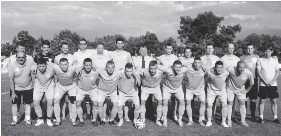
Székelyföld válogatottja a CONIFA honlapján közölt felvételen